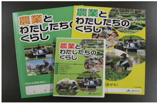
<28年度の教材本 「農業とわたしたちの暮らし」>