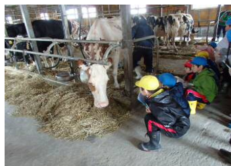
<食農教育事業>