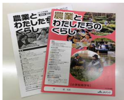
<30 年度の教材本 「農業とわたしたちの暮らし」>

また、J A、J A青年部・女性部などが地元の子どもたちを対象として、食農・環境・金融経済の教育活動の実践に取り組み、「農業体験学習」「学校給食の食材提供」「収穫した野菜を使った調理実習」「食農教育事業」など 90 件の活動が行われています。