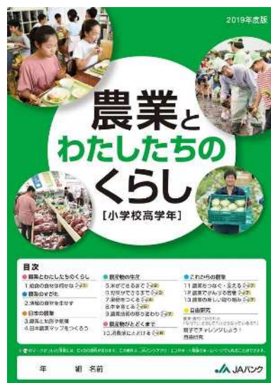
<教材本「農業とわたしたちの暮らし」>

補助教材本「農業とわたしたちの暮らし」は、J Aバンクを通じて全道1,044校の小学5年生（約41千人）と特別支援学校（15校）を対象に配布され、学校の授業等において活用されています。