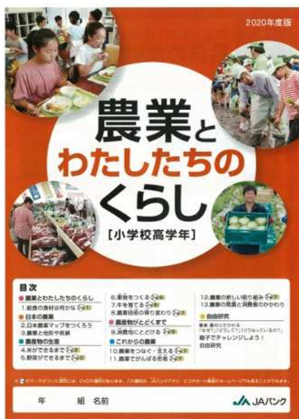
【贈呈した教材本およびDVD】

補助教材本「農業とわたしたちの暮らし」は、J Aバンクを通じて全道 1,043 校の小学 5 年生（約 4 万人）と特別支援学校（18 校）を対象に配布され、学校の授業等において活用されています。