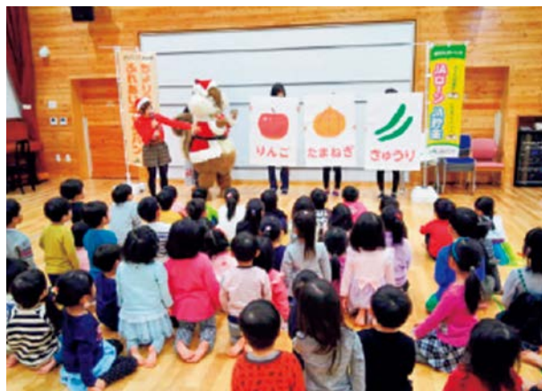
〈ちょリスとの野菜しりとりゲームに興味津々の子供たち〉