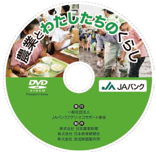
【贈呈した教材本およびDVD】