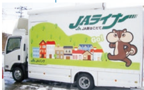
JA新はこだての移動店舗車

道内JAの店舗網については、JAバンク北海道HP ( http://www.jabank-hokkaido.or.jp/shinren ) をご確認ください。