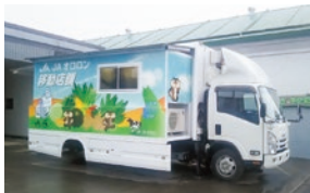
JAオロロンの移動店舗車

本所 TEL (011) 232-6010 札幌支所 TEL (011) 232-6060